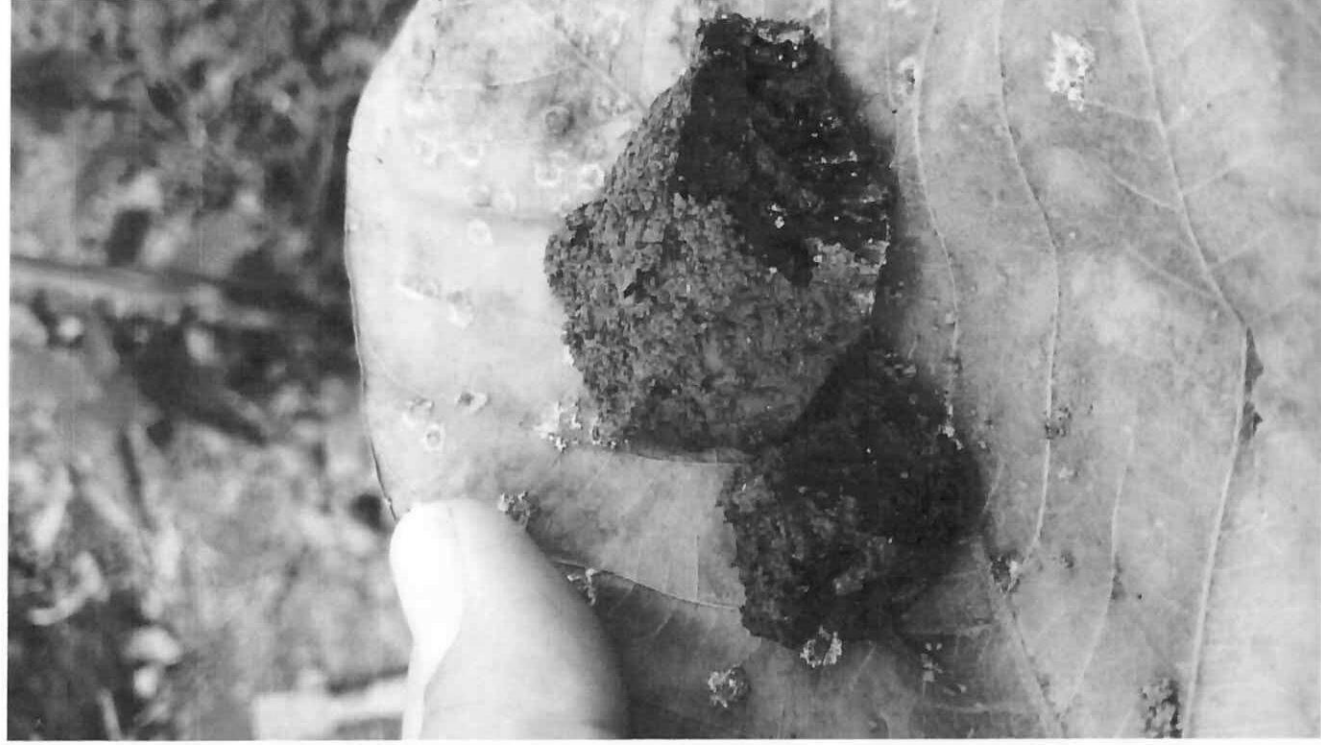
Figura 4. Fotografía de un fragmento de carbón recuperado dentro del barro del estrato frente al muro de piedras CC4c/8A (Parque Arqueológico Nacional Tak'alik Ab'aj, MICUDE-DGPCN/IDAEH 2021).