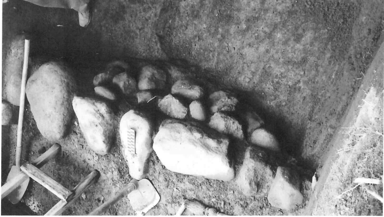
Figura 3. Fotografía del muro de piedras CC4c/8A (Parque Arqueológico Nacional Tak'alik Ab'aj, MICUDE-DGPCN/IDAEH 2021).